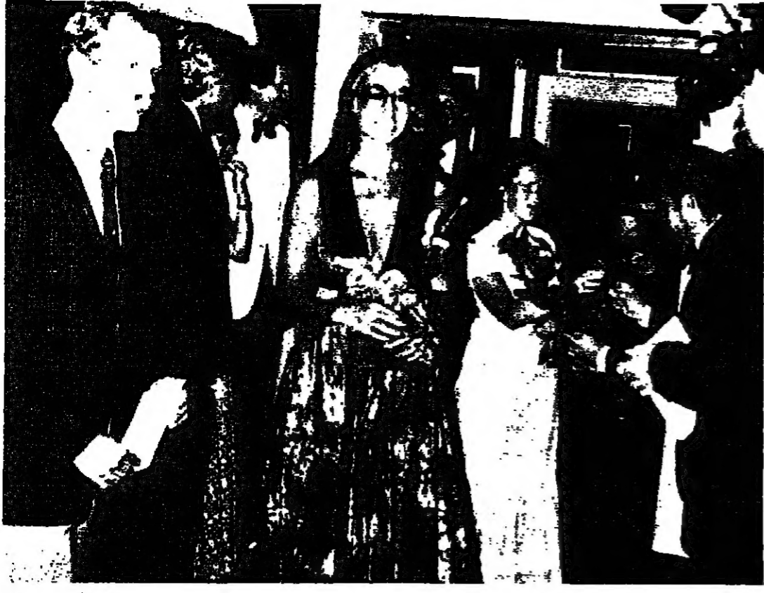
المندوبون الى حفلة الافتتاح